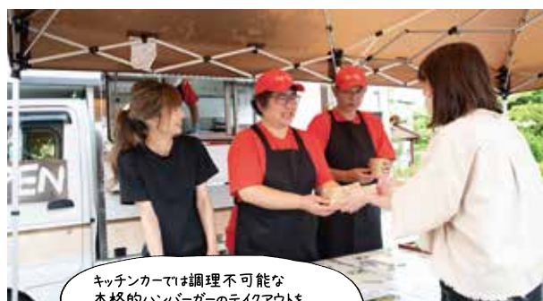
キッチンカーでは調理不可能な本格的ハンバーガーのテイクアウトをCafe'Villageで開始予定です(7月頃)