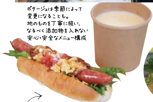
一番人気の「タコドック」は、ホットドックにオリジナルタコソースをたっぷりかけた一品。