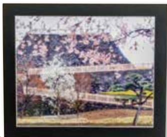
写真「甲府城」 白鳥 正次(77歳)