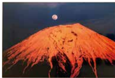
写真「朝霧高原からの富士」 斉藤 勝治(78歳)