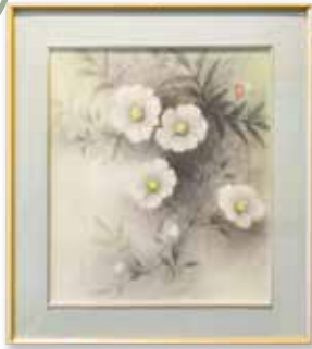
日本画「のうぜんかずら」 功刀 喜美子(78歳)