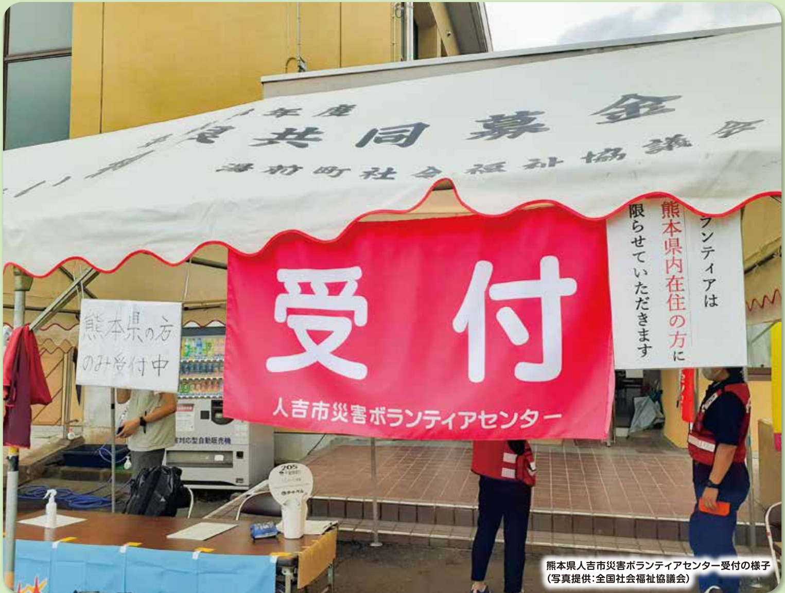
熊本県人吉市災害ボランティアセンター受付の様子