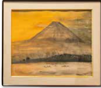
日本画「精進湖の朝焼け」 古屋 治史(79歳)