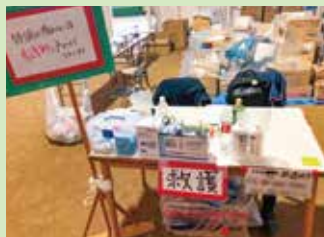
災害VC内に設置された救護所

被災した人を支援するためには、ボランティア自身が健康で安全に活動できることが重要です。そのため、これまでも災害VCでは救護班の設置、活動終了後の手洗い・うがいや長靴の洗浄・消毒など、ボランティアを病気やケガ、感染症から守る取り組みを行ってきました。