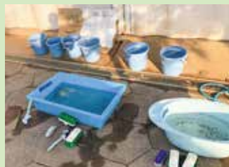
長靴の洗浄・消毒スペース