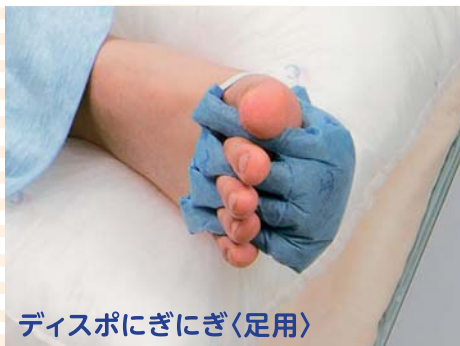
ディスポにぎにぎ<足用>

市販の緑茶ティーバッグをポケットに入れて使用することによって、手のひらの汗や湿気を吸収し、カテキンパワーが臭いの発生やただれを予防・緩和します。