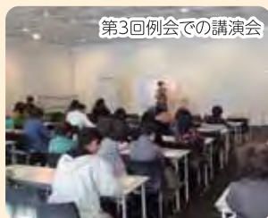
第3回例会での講演会

例会に合わせて「当事者スペース」も用意しました。ひきこもりの当事者の人たちが、気軽に参加して話をする場所