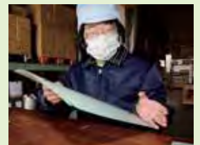
フラットファイルの組み立て作業 (社会福祉法人忠恕会 障害者支援施設 山梨クリナース酒折)