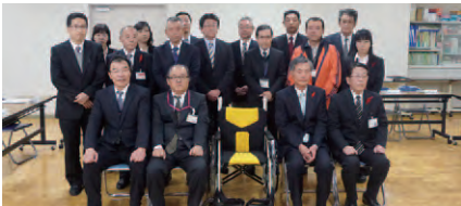
マックスパリュウ東海様と受贈者の皆さん