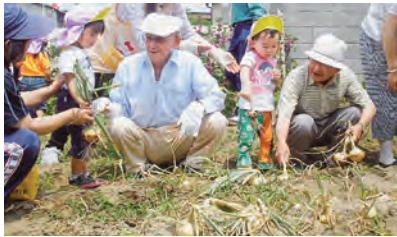
園児と仲良くタマネギ掘りをする入居者

「あやめの里」は甲斐市富竹新田にある軽費老人ホームです。入居者の平均年齢は83歳。家庭環境や住宅事情で家族との同居が難しい高齢者が共同生活しています。入居者は、音楽や趣味などの自主的な活動や行事を楽しみ、生きがいとなっています。20年以上にわたって、「同じ法人系列の『てんとう虫グループ』が運営する保育園や幼稚園と交流を続けています。創立記念日や秋祭り、どんど焼きなどの交流行事をはじめ、自主農園での野菜づくりなどを通して触れ合い