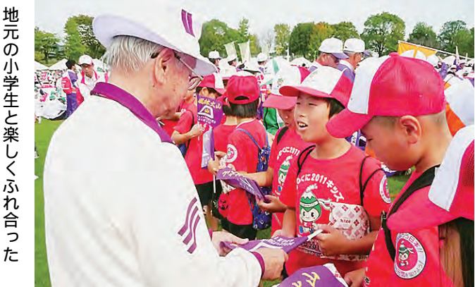
地元の小学生と楽しくふれ合った