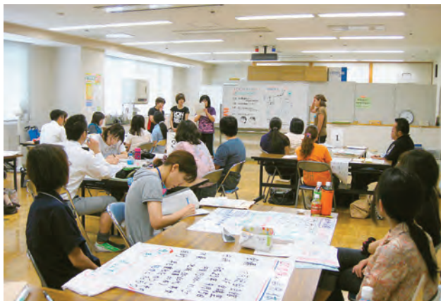
グループごとに疑似体験の方法を話し合った