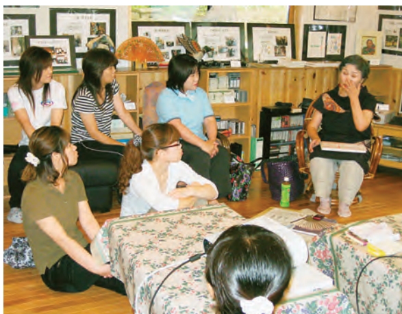
高齢者の体の特徴などを学ぶ参加者