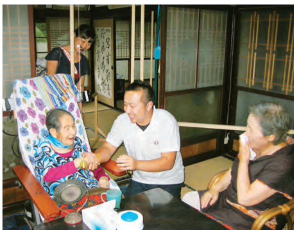
研修に参加した人を握手で迎えた