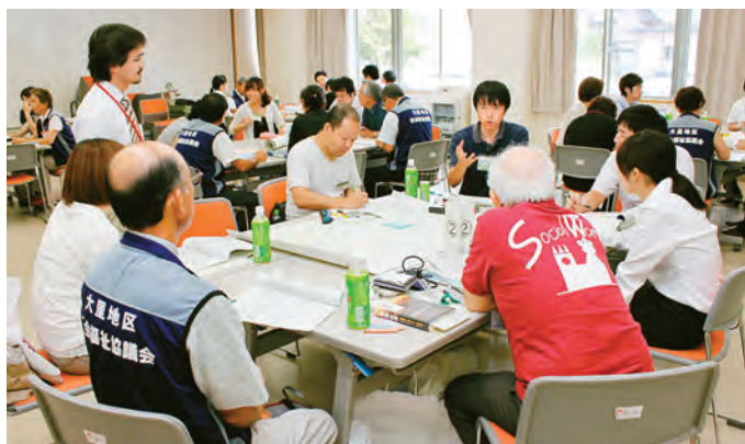
地元の社協のメンバーを交え、将来像について話し合った