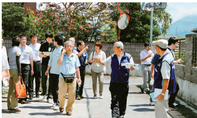
大里地区を実際に歩いて地域の状況を探る参加者