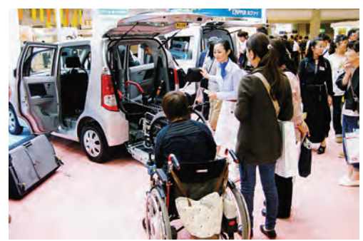
多くの福祉車両が展示された

の東北3県を中心とした社会就労センターで作った製品が販売されました。また、「ふくしの防災・避