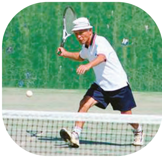
「絶好のボールだ」（ソフトテニス）