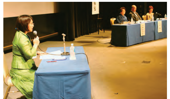
地域活動をテーマにしたリレートーク

最終日は、地域の住民活動から漏れた人たちを取り込む企画案が発表され、評価を受けていました。