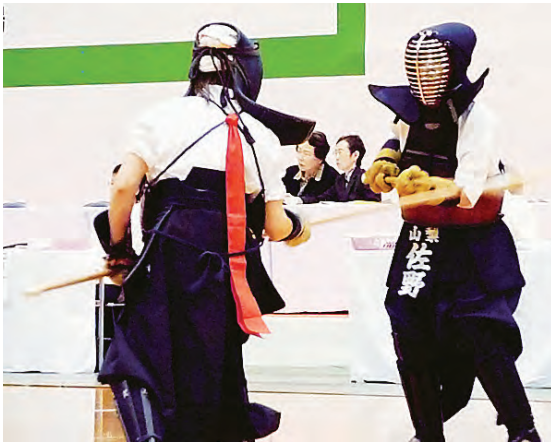
緊張感が張り詰める試合の行方は… (なぎなた)