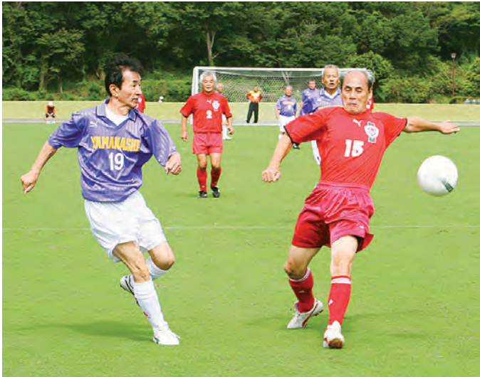
勝利を目指してナイスパス！（サッカー）