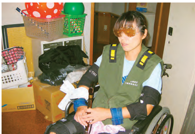
「共立介護福祉センター わかまつ」での研修の様子