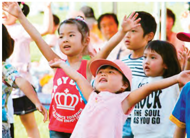
サクライザー体操、やるじゃんけ！（甲州戦記サクライザーショー）