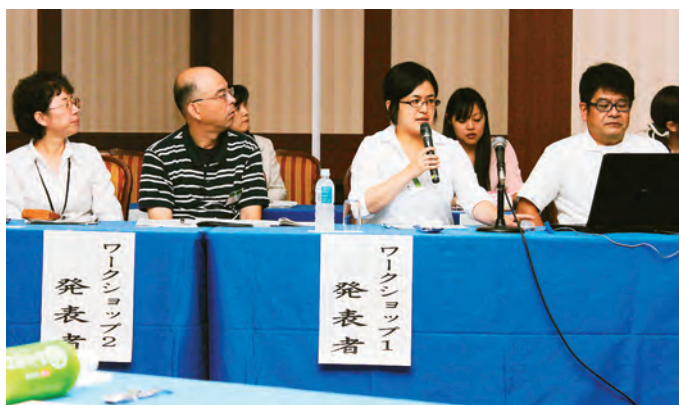
ワークショップの結果についてを発表した参加者

安心して暮らせる地域づくりを考える「山梨コミュニティソーシャルワークフォーラム・地域福祉実践研究セミナー」(県社会福祉協議会・日本地域福祉研究所主催)が、このほど甲府・富士屋ホテルなどを会場に開かれました。地域の絆(ぎずな)を、どう再生していくか。3日間にわたる討議の内容を報告します。