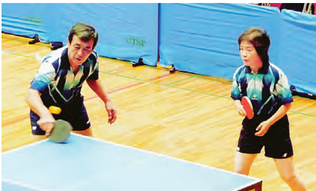
ぴったり息の合ったダブルス（卓球）