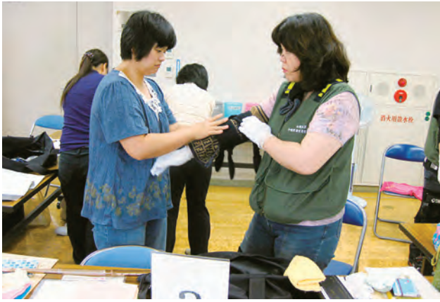
疑似体験セットの装着

県立介護実習普及センタ ーは、高齢者の目線で接客 や店舗の工夫ができるよ う、高齢者疑似体験セット の利用を広く呼びかけてい ます。当センター（電話0 55・254・8680） まで、気軽にお問い合わせ ください。