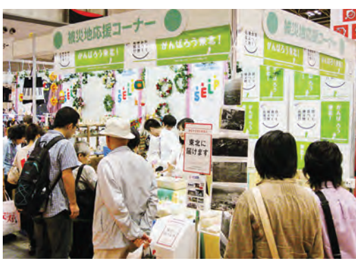
被災地支援のために設けられた特別コーナー