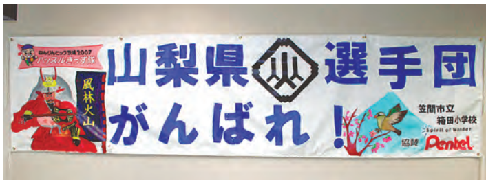
箱田小の子どもたちが作ってくれた応援横断幕