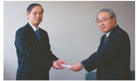
ありがとう、山梨県労働者福祉協会様（上）、連合山梨様（下）させていただきます。県社協企画課（電話055・254・8610）

している福祉サービス施設（事業者）にお話してください。事業者は社会福祉法に基づき、次の苦情解決体制を設けています。