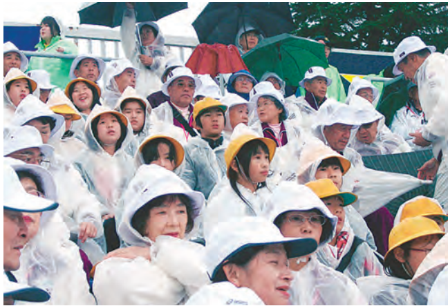
雨の中の開会式。地元箱田小の子どもたちと一緒に観覧