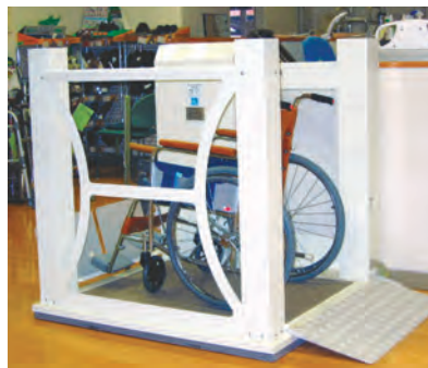
床工事は要りません