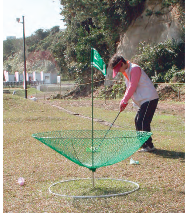
傘を逆さにしたようなネットや地面のリングにボールを入れる

使用するボールは、バドミントンの羽根を付けたような形が特徴。またプラスチック製（合成樹脂）で、体に当たっても安全な素材