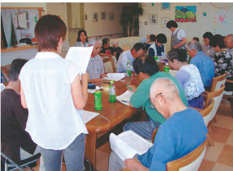
運営推進会議の様子「グループホーム笑がお」(甲府市)