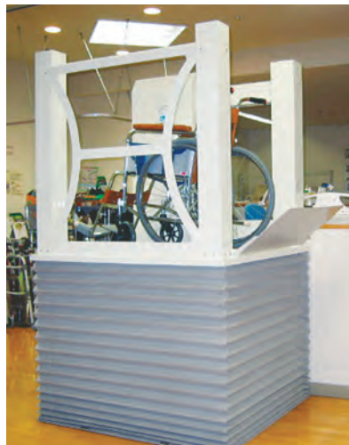
1.65mまで上昇できます