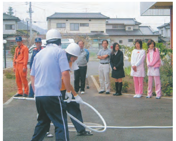
地域の方とともに防災訓練を行った「グループホーム甲西」(南アルプス市)