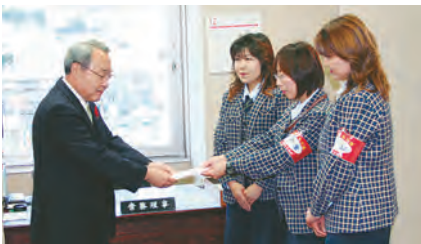
ありがとう、山梨ヤクルト販売様