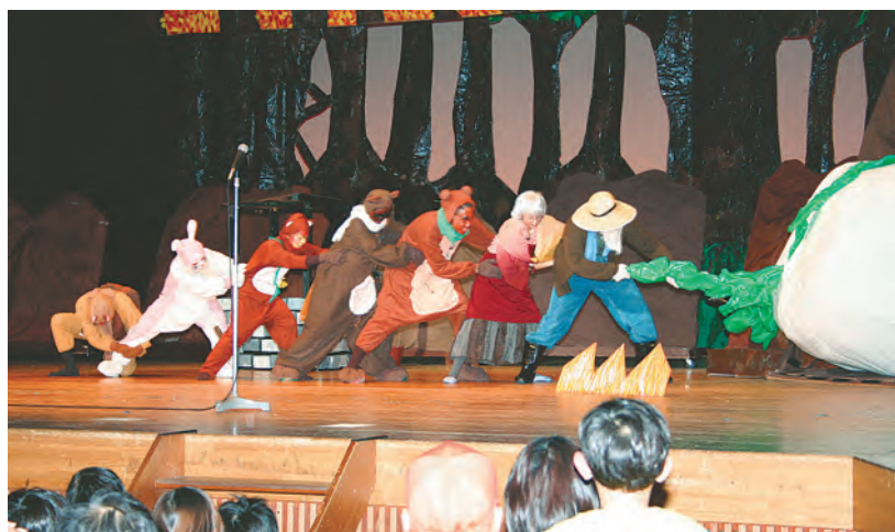
2年生が担当したオペレッタ「おおきなかぶ」の一場面

昭和42年に創立された帝京学園短期大学の教育目標は、学生の個性と可能性を伸ばし、幅広い知識を身に付けると同時に、実学（実技・実習・演習）を学ぶことです。保育系以外の学科を持つ単科短大として、乳幼児期の保育・教育の専門職を養成しています。 平成18年4月には、地域の子育て支援を実践するため、休園中の付属幼稚園を利用し「同短大子育て支援研究所」を設立しました。 平成18年度、県から委託を受けた「やまなし子育て支援地域モデル事業」は、「ほくとで子育て応援マップ」