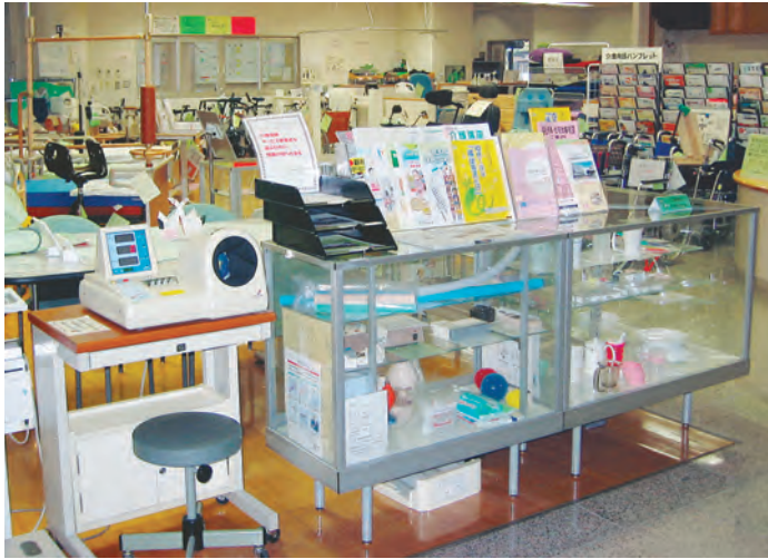
展示室内の血圧測定器もご利用ください（写真左）

展示に当たっては、販売店などからの申請を受け、学識経験者や理学療法士、作業療法士などが集まりました。昨年8月に展示許可した福祉用具を一部ご紹介します。