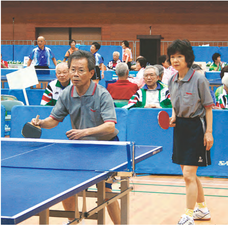
小さなピンポン 玉を追う目は真 剣そのもの