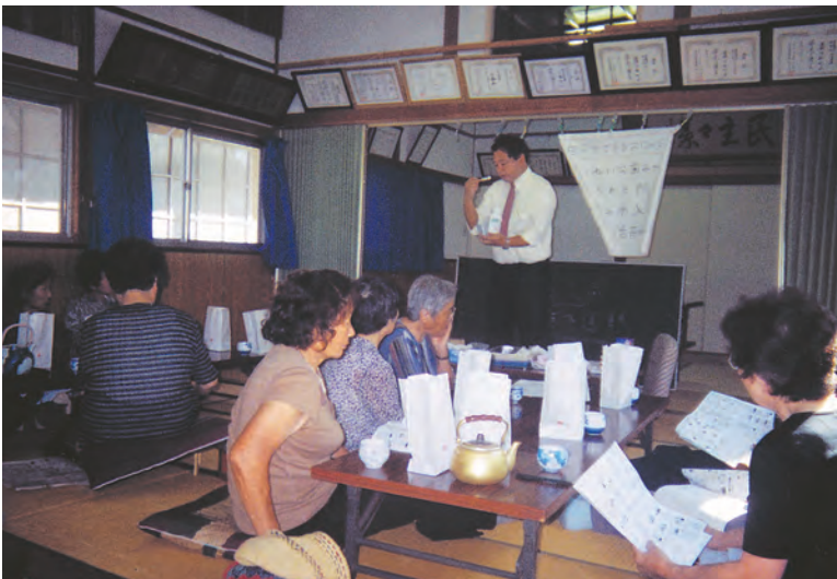
地域の方を対象に口腔ケア教室を開いた「グループホームめだかの学校」(山梨市)