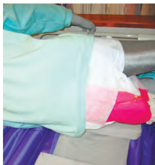
おむつの中は温風で快適

(5) 温水でお尻を洗浄 (6) 温風で乾燥 装置をつけていても、あ る程度は自由に寝返りや体 位交換ができるので安心で す。