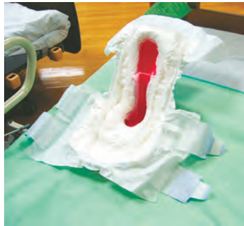
専用おむつを用意

(1) おむつカップに専用 おむつ (別売) を取り付け る (2) 要介護者の体にしっ