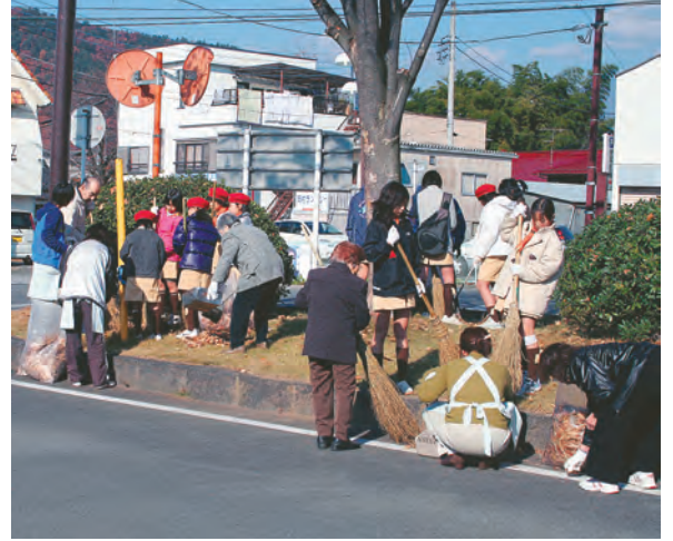
地域の清掃活動を行う「グループホームアゼリア」(甲州市)