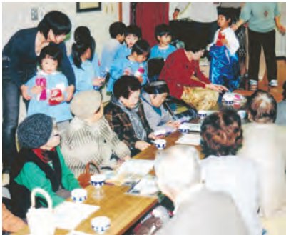
保育園児と交流するお年寄り

手作りのめがねケースを用意。参加者1人ひとりに手渡し、和やかなふれあいの場となりました。また老人福祉センター舞踊部が、1年間の練習成果を参加者に見てもらおうと、踊りを披露しました。