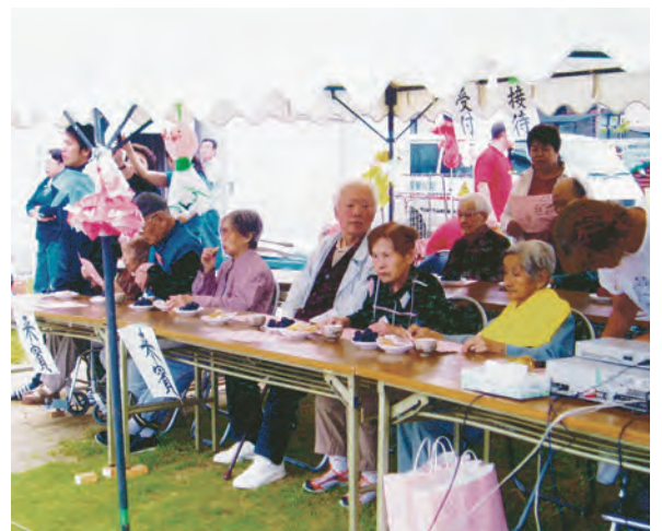
相川保育園の運動会に参加した「グループホーム山径」(甲府市)