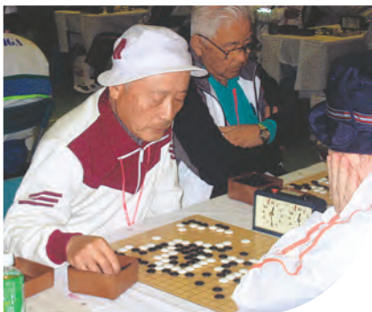
「さあ、勝負はこれからだ」 と精神集中が続く