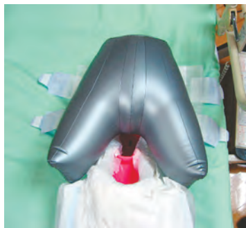
おむつをしっかり装着

かりと装着する (3) センサーが排便・排 尿を感知する (4) 即座に汚物を自動吸 引する