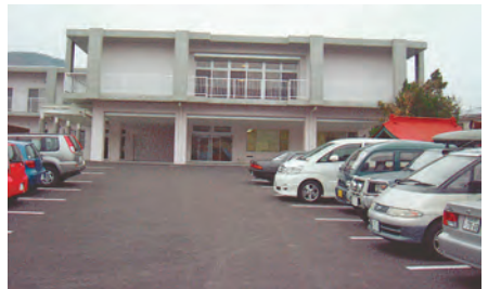
福寿荘きらきらの外観

昨年4月、増穂町に開設した「福寿荘きらきら」は定員30人の特別養護老人ホームです。居室は、1人ひとりの個性と生活リズムを尊重した全室個室となっています。