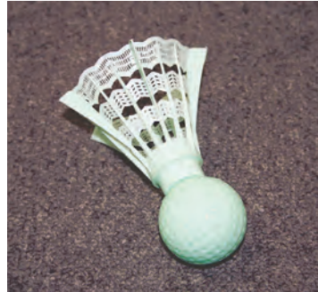
羽根の付いたボール

離が短く、ゴルフクラブ一本と専用ボール1個があれば、簡単にプレーすることができます。