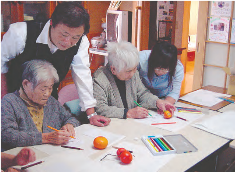
絵手紙に挑戦した「グループホームめだかの学校」(山梨市)