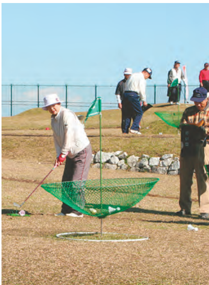
傘を逆さにしたようなホール が特徴の「ターゲット・バード ゴルフ」(14面参照)