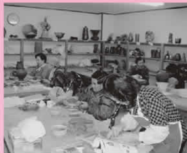
陶器作りを楽しむお年寄りたち

ら「健康に気を付けて下さい。何か困ったことがあったら民生委員、社協へ連絡して下さい」などのメッセージが添えられ、ボランティアグループ「こまどりの会」のみなさんがお宅まで届けます。利用者からは季節の手作りのお弁当が味わえると評判も上々です。 同社協では、この他にも老人クラブの方々と協力し、月に一度福祉センターにお年寄りを招いてレクリエーションなどを行う「憩いの日」を実施するなど、地域ぐるみで高齢化を支えています。