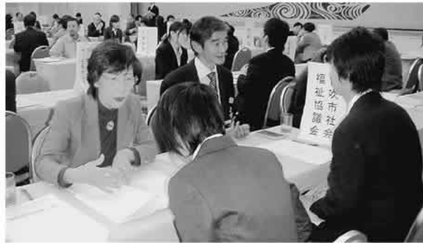
熱気に溢れた冬季福祉ワークガイドダンス