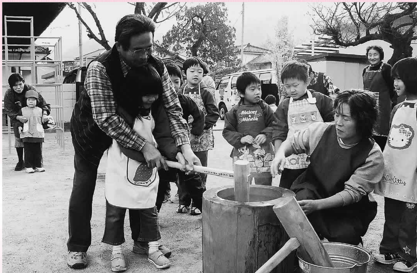
お餅つき 市川大門町・高田保育園

おじいちゃん・おばあちゃんと一緒に餅つきにチャレンジ。出来上がったお餅にきな粉やあんこなどをまぶして、美味しく頂きました。