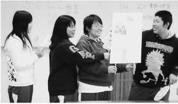
41人が参加した高校生のための福祉の仕事セミナー

県内外の学生や一般の方など250人が参加。求人者と直接面談ができる合同面接コーナーでは、希望施設へ相談に向かう求職者が熱気に溢れていました。求人については、福祉施設や介護保険事業所な