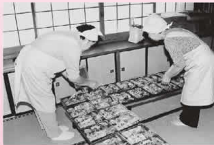
高齢者宅などにお弁当を届ける食事サービス

推進員が、交互に実施しています。 お弁当は季節の食材を使い、朝早くから午後にかけて80食分を用意します。出来上がった弁当にボランティアが